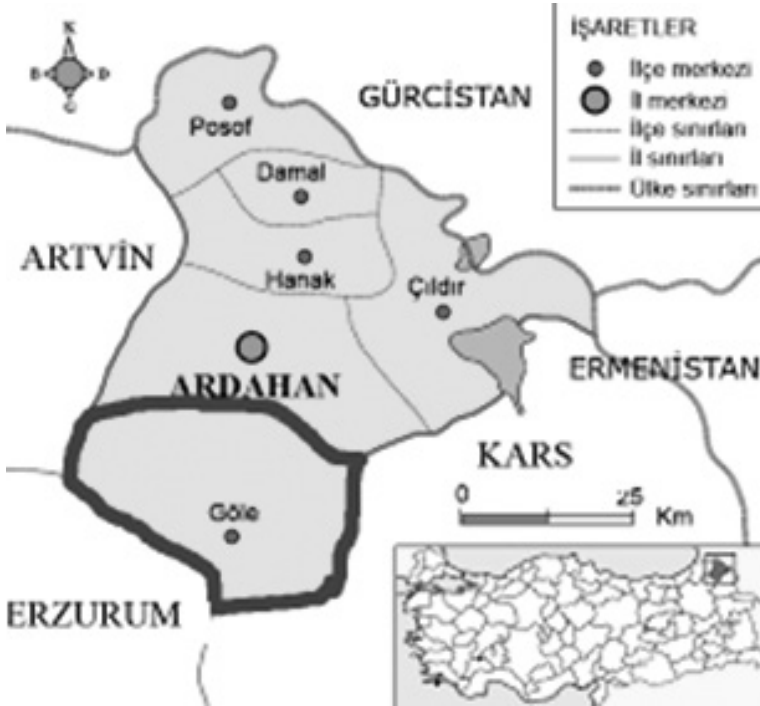
Resim 1: Göle Haritası

Ardahan ili Türkiye'nin kuzey doğusunda bulunmakta olup merkez dâhil 6 ilçeye sahiptir. Ardahan'ın en büyük ilçesi durumunda bulunan Göle ilçesinin nüfusu 25.178'dir ve toplamda 52 köyü bulunmaktadır. İlçenin kuzeyinde Artvin ve Ardahan, batısında Erzurum ve doğu ve güneyinde Kars ili ile sınırı bulunmaktadır. 1992 yılına kadar Kars iline bağlı olan Göle bu tarihten sonra Ardahan'ın il olması ile birlikte Ardahan'a bağlanmıştır. Nüfusunun büyük bir çoğunluğu (%76) köylerde yaşayan ve temel geçim kaynağı büyük baş hayvancılık olan Göle ilçesi, cumhuriyetin ilk kurulduğu yıllardan beri büyükbaş hayvancılık sektöründe önemli bir yere sahiptir.